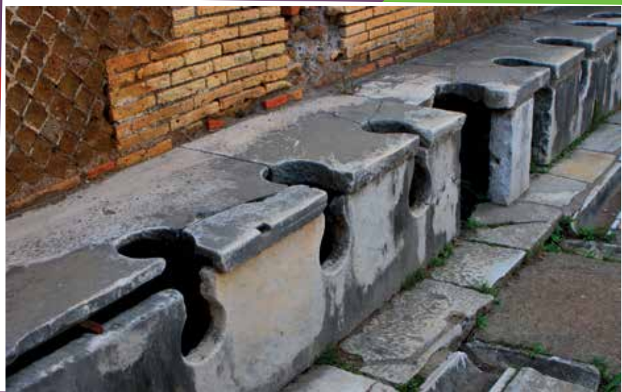
Openbare toiletten waar de Romeinen het weer en de roddels met elkaar bespraken. Zulke wc's kun je bij Romeinse opgravingen nog steeds zien.